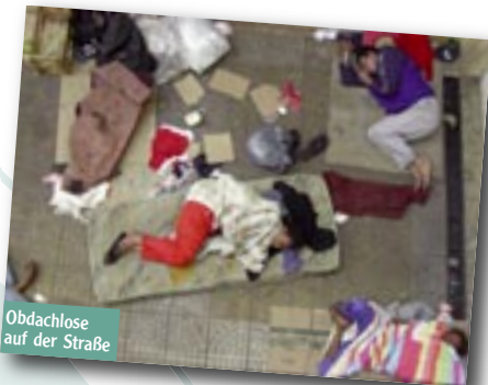
Obdachlose auf der Straße