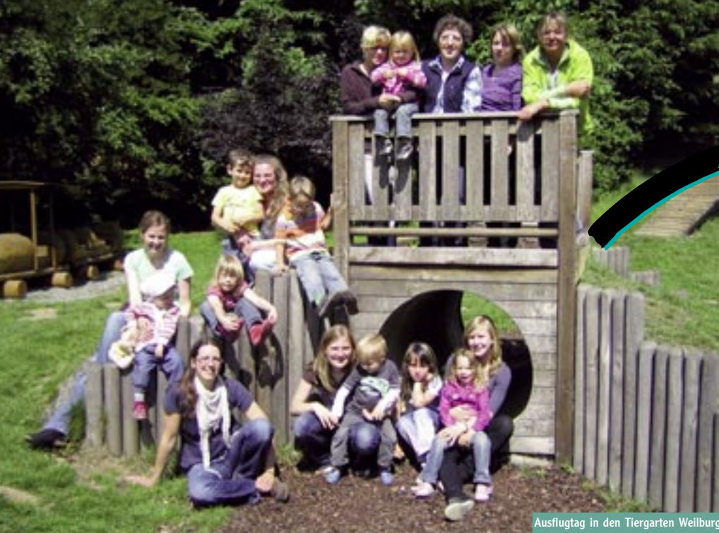
Ausflugtag in den Tiergarten Weilburg

Sparkasse Gießen BLZ 513 500 25 Konto 284 017 000